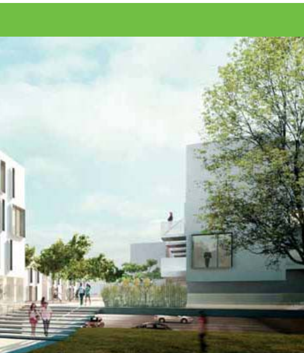
mme de Nantes Habitat respecte les principes de l'éco-quartier.

sage ni pesticides... L'opération du parc de la Canopia, c'est son nom, sera certifiée Habitat et environnement. Ce qui prévoit également que les locataires, qui pourront emménager fin 2011, soient informés des "gestes verts" pour réduire leur consommation d'énergie et les nuisances sur l'environnement.