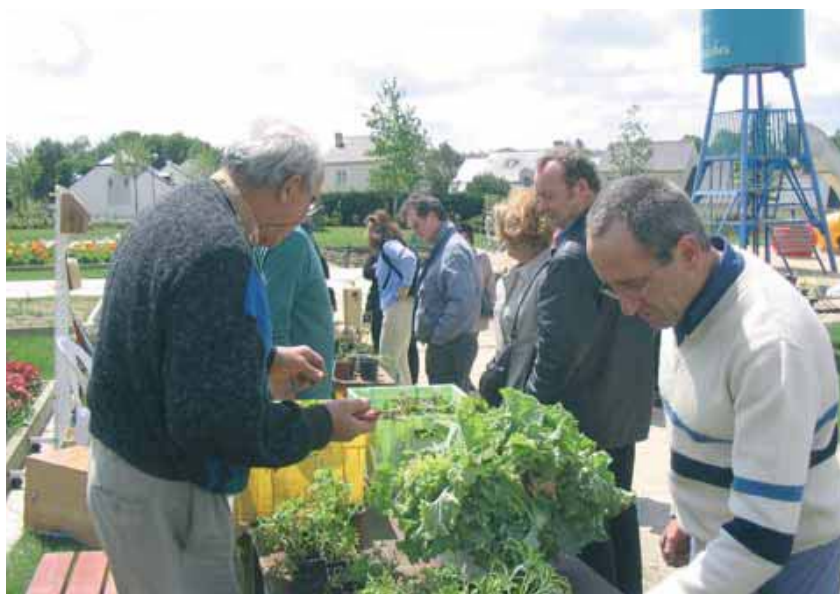
Troc'Plantes, le 25 avril au jardin des Maraîches.