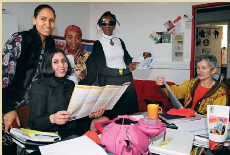
"Chez nous" : un lieu collectif pour se rencontrer, échanger.

Contact : association Tak-apres, tél. 02 53 00 35 61.